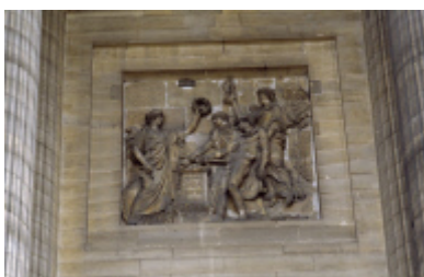
Moyen-relief du Panthéon : guerrier à l'agonie accompagné des allégories de la patrie, la force et la gloire.

Du grec, « autre chose » et « parler en public » l'allégorie est une forme de représentation indirecte qui utilise une chose pour représenter souvent une idée abstraite ou une idée morale. Utilisée depuis l'Antiquité sous sa forme littéraire et sous sa forme figurative dans la peinture et la sculpture, elle est reprise, comme langage privilégié, au XVIII ème siècle, à l'époque néoclassique.