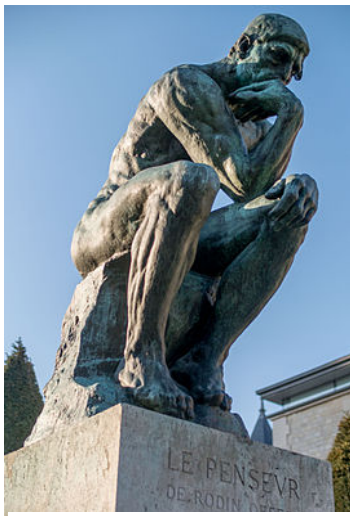
Le penseur de Rodin, 1882

Les ambitions pour le Panthéon sur les nouveaux décors en peinture et en sculpture sous la III ème République ne seront pas toutes satisfaites. Parfois les artistes interpellés ne participent pas, parfois les commandes trouvent des difficultés financières pour aboutir. Dans cet élan de renouveau décoratif pour l'édifice les sculptures qui s'installent sont accompagnées par la sortie d'autres qui étaient jugées n'avoir pas leur place dans le monument. Ainsi fut pour une statue assez emblématique : Le Penseur de Rodin installée au Panthéon au début du siècle.