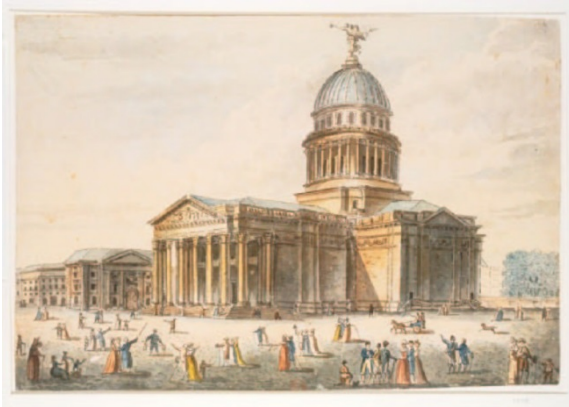
Panthéon, Pierre-Antoine de Machy, 1792

L'étude du décor sculpté et de la statuaire du Panthéon permet d'aborder d'une façon plus pointue l'histoire du monument par son aspect peut-être le moins connu : celui de la sculpture allégorique et symbolique du XIX ème siècle et celle commémorative du XX ème . Tout d'abord il faut séparer distinctement les parties sculptées qui sont visible à l'extérieur sur le fronton et sur la façade au-dessus du portail principal, des sculptures qui se trouvent à l'intérieur, dans la croisée, les transepts et l'abside. Ces productions font partie de deux programmes réalisés à deux époques différentes : les premières sont exécutées avant la moitié du XIX ème siècle tandis que celles à l'intérieur appartiennent à la