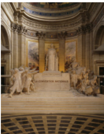
La Convention nationale, François Sicard, 1921

La commande publique de cette composition est passée à l'artiste en 1907 elle devait être au départ un monument à la Révolution française destiné aux jardins des Tuileries. En 1911 elle est installée au Panthéon où elle prend la place de l'ancien autel dans l'abside. La Convention nationale est l'assemblée qui, prenant le relais de l'Assemblée constituante et de l'Assemblée législative, a proclamé la 1 ère République en 1792. Cette œuvre manifeste l'intention de la Troisième République de témoigner de sa filiation directe avec la 1 ère République en transmettant le culte de la patrie, de l'honneur et du combat.