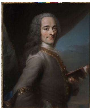
Portrait de Voltaire

Un hommage est rendu Diderot au Panthéon mais son corps repose ailleurs 4 . Il s'est très vite passionné pour les sciences de la vie, les mathématiques mais également la chimie. Il mena des traductions telles que celle de l'ouvrage de Robert James « Dictionnaire universel de médecine » mais il écrivit également différents mémoires tels que les « Mémoires sur différents sujets de mathématiques » ou encore « Introduction à la chimie ».