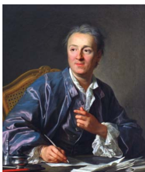
Portrait de Denis Diderot

C'est le tombeau de Diderot qui est représenté en plan couché où apparaît le profil du Grand Homme et également l'inscription « Diderot 1784 ». Ici, l'idée d'Encyclopédie prépare également l'idée de la Révolution Française.