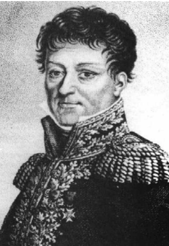
Portrait de Lazare Carnot