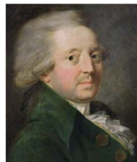
Portrait du Marquis de Condorcet (1743-1794)

Pour ses nombreux travaux scientifiques, Condorcet est élu à l'Académie royale des sciences le 25 février 1769.