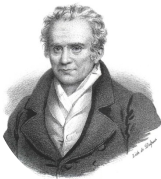
Portrait de Gaspard Monge

Instruit en Histoire, en science naturelle et en mathématiques, Gaspard Monge est engagé comme dessinateur en 1765 à l'école royale du génie de Mezières où il fait la connaissance de Charles Bossut, professeur de mathématiques. Il lui est alors confié des plans de fortifications. Dès 1766, il supplée les cours de Bossut en tant que répétiteur 6 de mathématiques. Il fait même rentrer le domaine de la géométrie descriptive au sein de l'enseignement de l'école ; une nouvelle branche des mathématiques qu'il a lui-même créé. La géométrie descriptive consiste à résoudre graphiquement des problèmes géométriques tels que les problèmes d'intersection ou les problèmes d'ombres entre volumes dans un espace en trois dimensions.