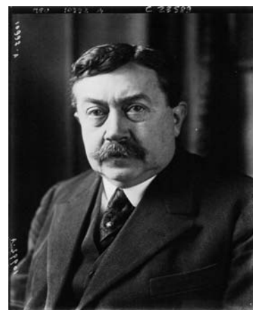
Portrait de Paul Painlevé, Député de l'Académie des Sciences

Parmi ses travaux en mathématiques les plus célèbres restent « Leçons sur la théorie analytique des équations différentielles ». Il mène également des recherches en mécanique des fluides et mit au point une formule qui prétend que le vol était possible. En plein contexte de la conquête des airs, il fut le premier passager des frères Wright en 1908 ; un vol qui dura 70 minutes, un vrai record ! C'est d'ailleurs lui qui a obtenu du gouvernement des crédits pour l'achat d'avions dès 1910. Au travers de différentes postes, il a agi activement pour la défense nationale.