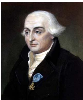
Portrait de Joseph-Louis Lagrange

Joseph-Louis Lagrange, italien de naissance est très vite passionné par les mathématiques. Il travaille dès l'âge de 19 ans sur l'application du calcul variationnel, l'application des mathématiques à des problèmes mécaniques tels que la propagation du son et la corde vibrante. Il gagne en 1764 le prix de l'Académie des Sciences de Paris suite à ses travaux sur les libérations, des petites variations de la Lune.