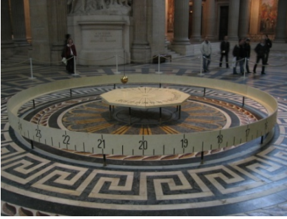
Le pendule de Foucault au Panthéon

Le Soleil se levant à l'est et se couchant à l'ouest, les gens ont longtemps cru que la Terre était immobile et que les corps célestes tournaient autour d'elle en un jour. C'est ce qu'on appelle le géocentrisme . Cette théorie a notamment été développée et reprise par Aristote ou encore Ptolémée. Ce point de vue va prédominer jusqu'au XVI ème siècle. C'est Nicolas Copernic qui va remettre en cause cette théorie de l'immobilité de la Terre. Il envisage lui un héliocentrisme : la Terre tourne autour du Soleil en une année et elle exerce une rotation autour de l'axe des pôles en un jour.