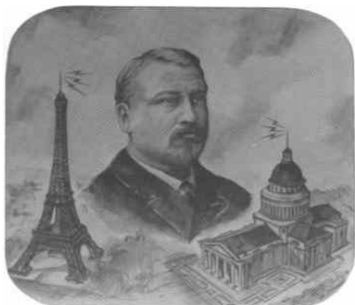
Eugène Ducretet et la TSF

Eugène Ducretet, scientifique et industriel français a participé activement à l'essor de la télégraphie sans fil (TSF) en France. Il s'agit d'un système qui permet de communiquer à distance en utilisant des ondes électromagnétiques.