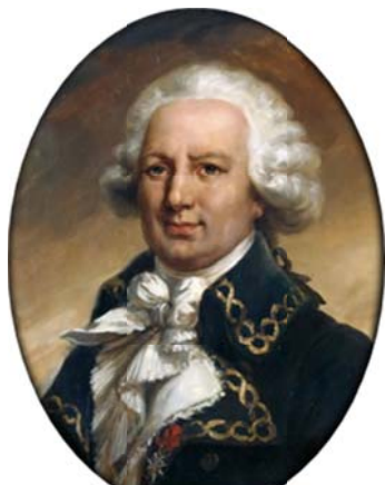
Portrait de Louis-Antoine de Bougainville