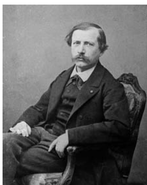
Photographie de Marcellin Berthelot (1827-1907), chimiste français

Chimiste et biologiste, Berthelot étudie à la faculté des Sciences de Paris et obtient son doctorat en sciences en 1854 grâce à ses travaux sur la combinaison glycérine avec acides et la reproduction des corps gras neutres naturels.