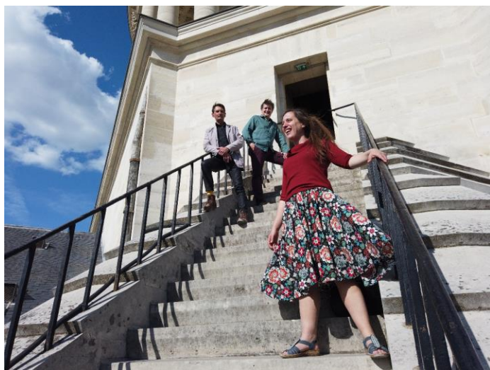
Les conteurs d'Une soirée dans les hauteurs dans l'escalier du panorama