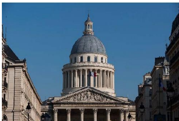
Vue extérieure du Panthéon