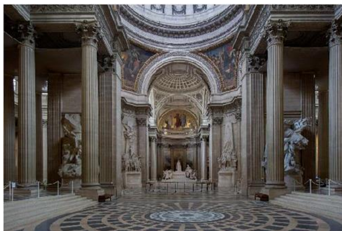
Vue intérieure du Panthéon