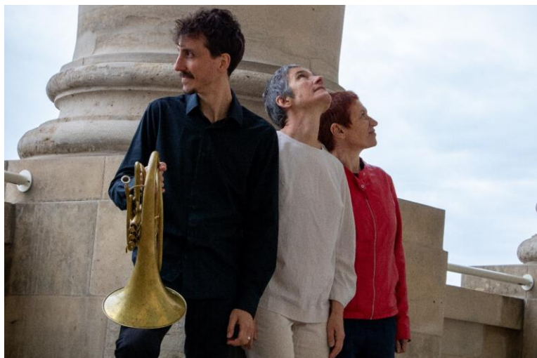
Les conteurs d'Une soirée dans les hauteurs dans les hauteurs du Panthéon