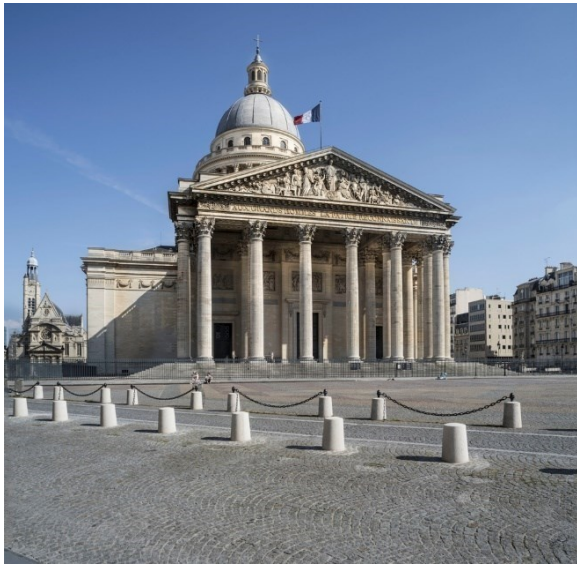
Titre : Panthéon, façade occidentale