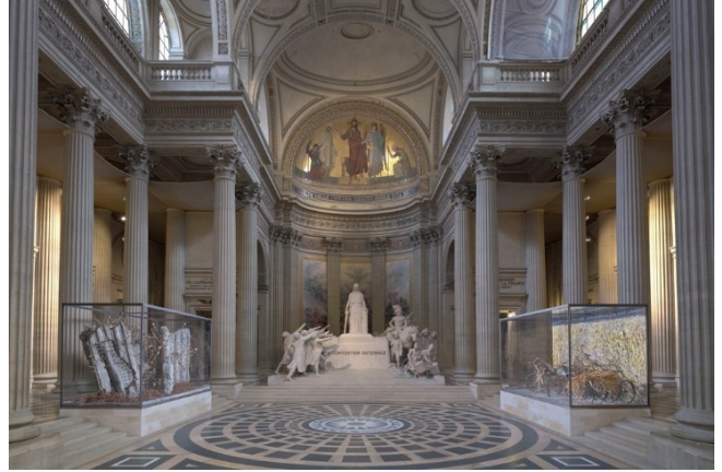
Droits d'auteur(s)/Mentions obligatoires : © Anselm Kiefer Titre : Panthéon, chœur