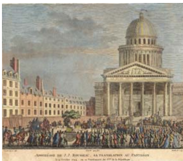
Les transferts des cendres du Rousseau le 11 octobre 1794 Musée Rousseau Montmorency

Les funérailles constituent un véritable rite de passage entre le corps du défunt et la communauté à laquelle il appartenait au cours de sa vie. Certaines funérailles ne restent pas confinées à la sphère privée et sont chargées d'une signification politique. Pendant la Révolution les funérailles républicaines vont jouer un rôle très important, car elles vont donner naissance à un sacre qui n'est plus religieux, mais véritablement républicain.