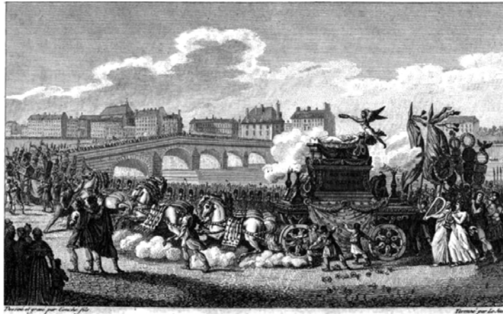
Translation du corps de Voltaire au Panthéon. Le 11 Juillet 1793.