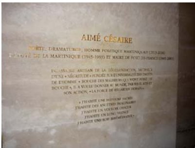
Inscription en hommage à Aimé Césaire avril 2012

nécessité de reconstruire la nation autour du souvenir de ses militaires a abouti à l'intégration sur les murs du chœur du Panthéon de listes d'écrivains morts. Différentes commémorations ont distingué d'autres personnalités : les aviateurs Georges Guynemer et Antoine de Saint-Exupéry mais également Aimé Césaire dont la dépouille repose en Martinique.