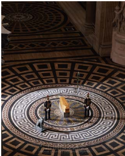
Panthéonisation d'André Malraux 1996

Progressivement, la panthéonisation devient l'un de ces geste qui « font le président » et atteste que le chef d'Etat est bien l'incarnation de la nation, le garant de son présent et de son futur mais aussi celui de son passé. Le modèle de cérémonie de la IIIème République est abandonné car trop proche du modèle funéraire et de ses pompes (corbillard, couronnes, Panthéon tendu en noir), or celui-ci ne paraît plus en harmonie avec les sensibilités contemporaines et avec l'attitude collective devant la mort aujourd'hui. Le rituel assume des formes de plus en plus dépouillées.