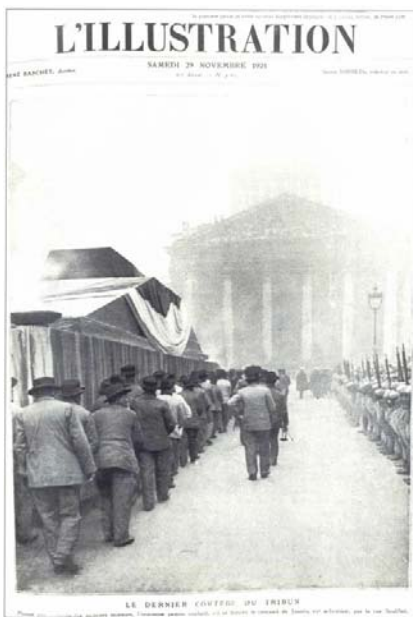
Le transfert des cendres de Jean Jaurès, 1924

Tout au long du XIXème siècle, l'institution du Panthéon et l'affectation de l'édifice sont sans cesse remises en cause. Malgré ces vicissitudes, le culte des grands hommes continue de passionner l'opinion et reste un trait marquant de la culture nationale. Ce siècle devient le siècle de la mémoire nationale supportée par la publication des grandes synthèses historiques comme l'Histoire de France de Michelet ou la Biographie universelle de Michaud.