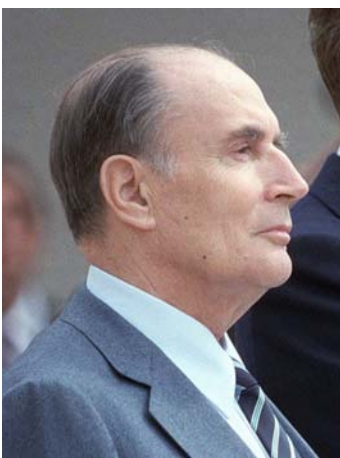
François Mitterrand, 1984

Le président De Gaulle transfère en 1964 le corps du résistant Jean Moulin mais le Panthéon ne parvient pas à retrouver une place centrale dans la vie républicaine. Pendant plus de vingt ans, le monument est très peu entretenu et déserté, trop marqué par le souvenir de la III ème République et des mouvements de mai 68. C'est avec Mitterrand que l'édifice redevient un lieu symbolique important. En 1981, la cérémonie d'inauguration de sa présidence, très médiatisée, inclut une visite au Panthéon. Le lieu renoue ainsi avec la tradition en redevenant un rite porteur d'une forte charge émotionnelle et d'une forte valeur politique.