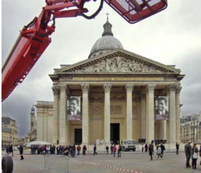
Préparation du monument pour l'hommage à Aimé Césaire avril 2012

Le Panthéon, dans son histoire de temple laïc, a vu défilé nombre de propositions de panthéonisations qui n'ont pas toujours abouti. Les débats n'ont jamais cessé et la scène médiatique continue de les animer lorsqu'un nom est avancé pour qu'il soit enterré en ce lieu. La liste des personnalités qui n'ont pas été acceptées ne cesse de s'allonger, comme la proposition de Romain Rolland ou Charles Péguy ou celle plus récente d'Albert Camus refusée par les familles. Malgré cela les murs de l'édifice nous rappellent que d'autres cérémonies peuvent avoir lieu dans le monument. Depuis la Première Guerre Mondiale, la